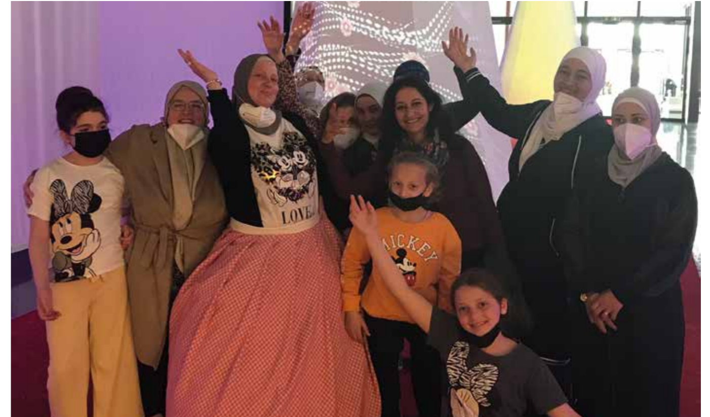
„Einmal Sissi und zurück“ Textil- und Industriemuseum Augsburg