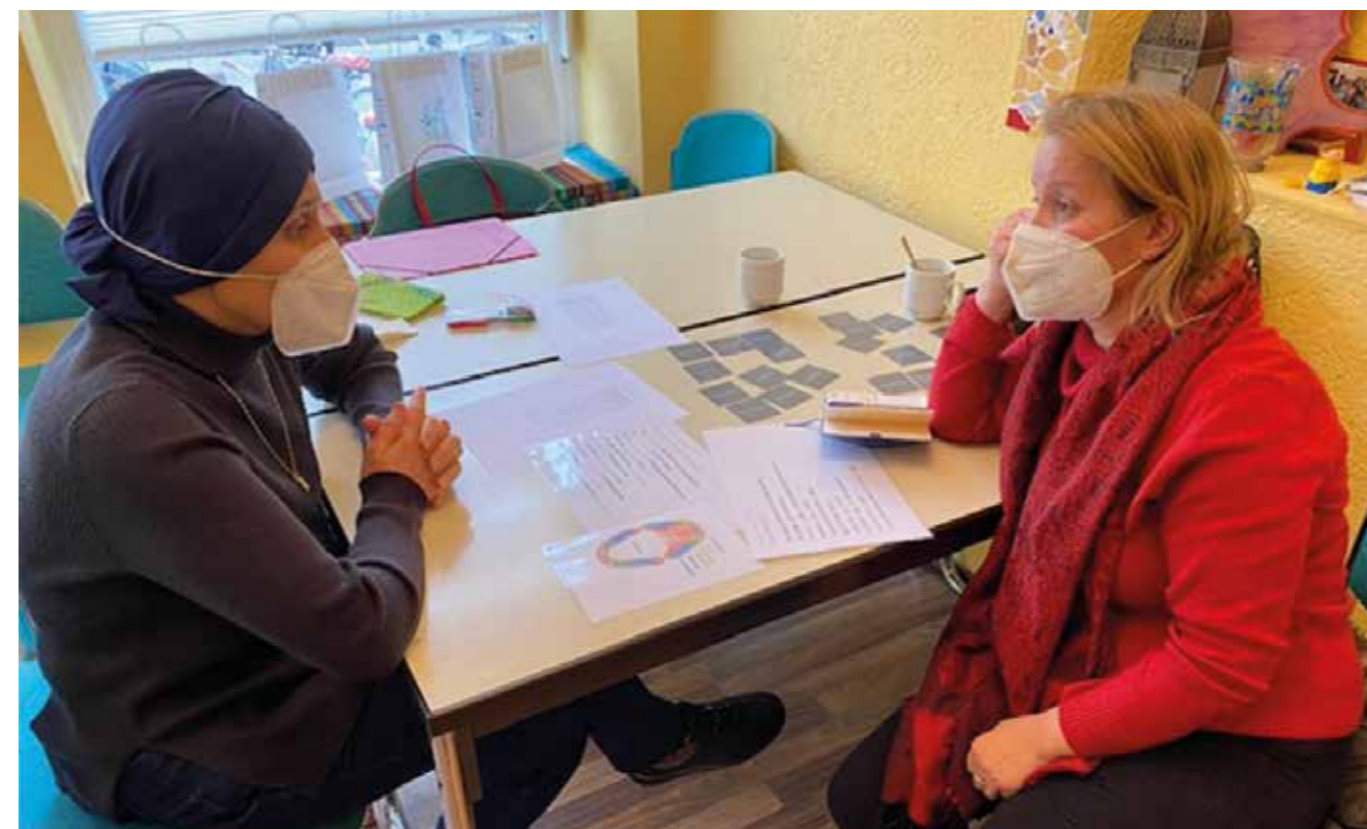
„Praxisdeutsch“ wird zur MonteMigra Sprachwerkstatt