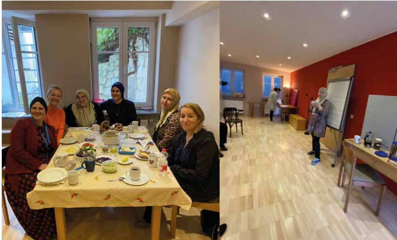
„Ein Zimmer für uns allein“ Pfarrheim miteinander