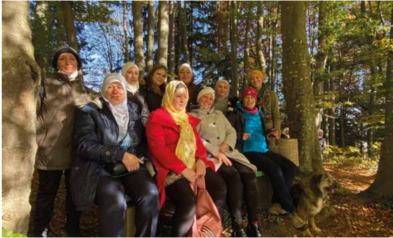
„Peissenbergs Walhall“ Auf den Spuren von Augspurg & Heymann