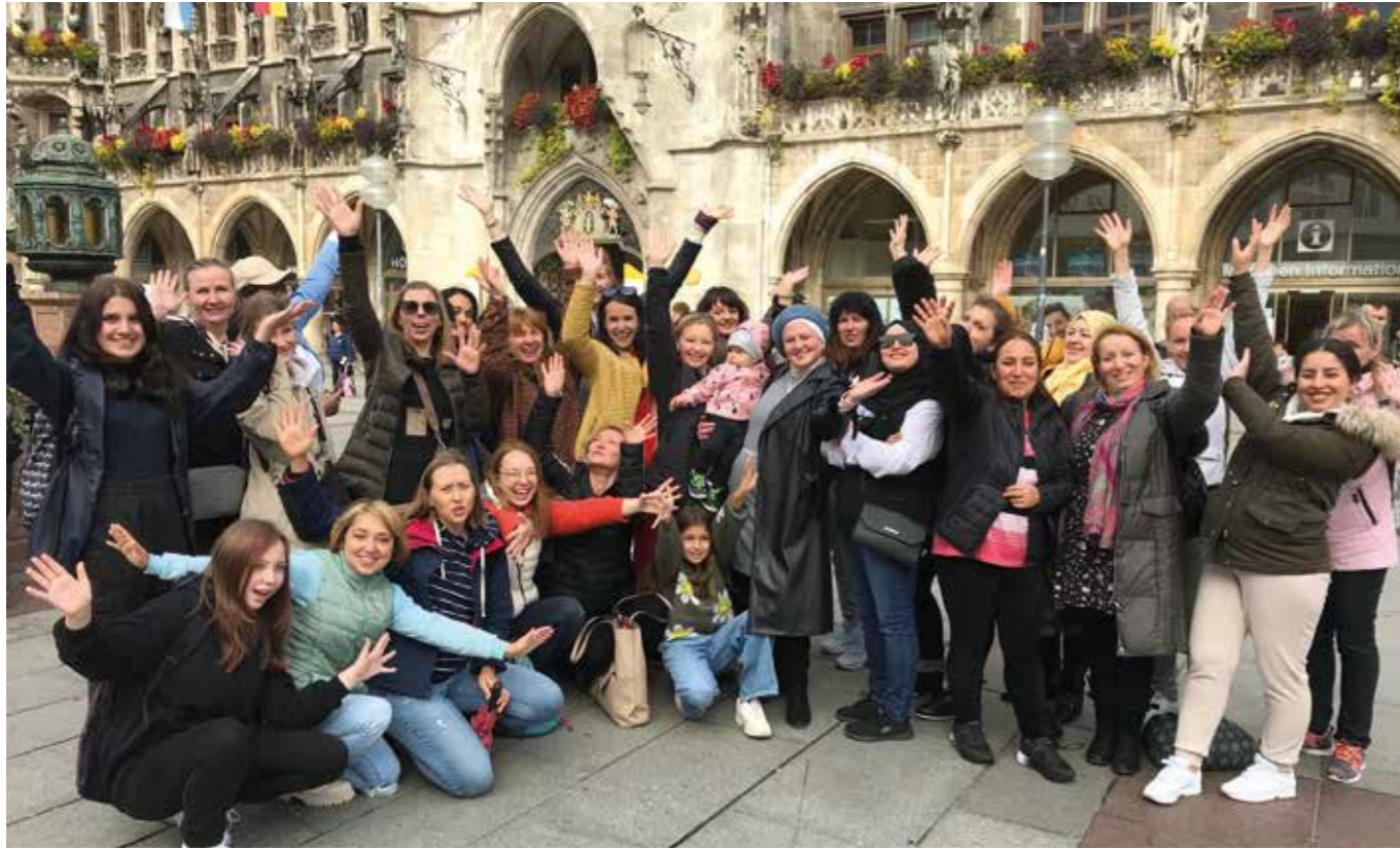
„FrauenStadtFührung München“ Letzter Ausflug