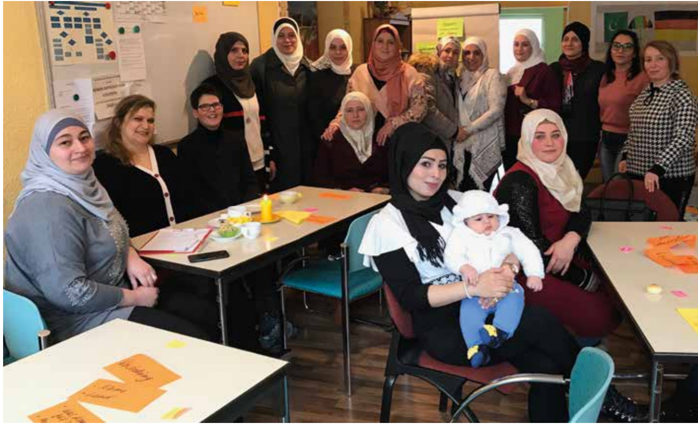
„Ich bin mabsota“