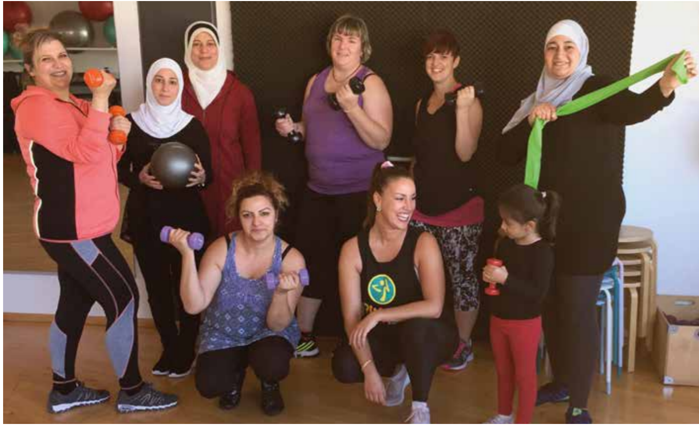
„Samstagssport“ im Rosenhof