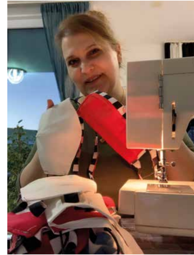
„Maskennähen“ im ersten Corona Lockdown