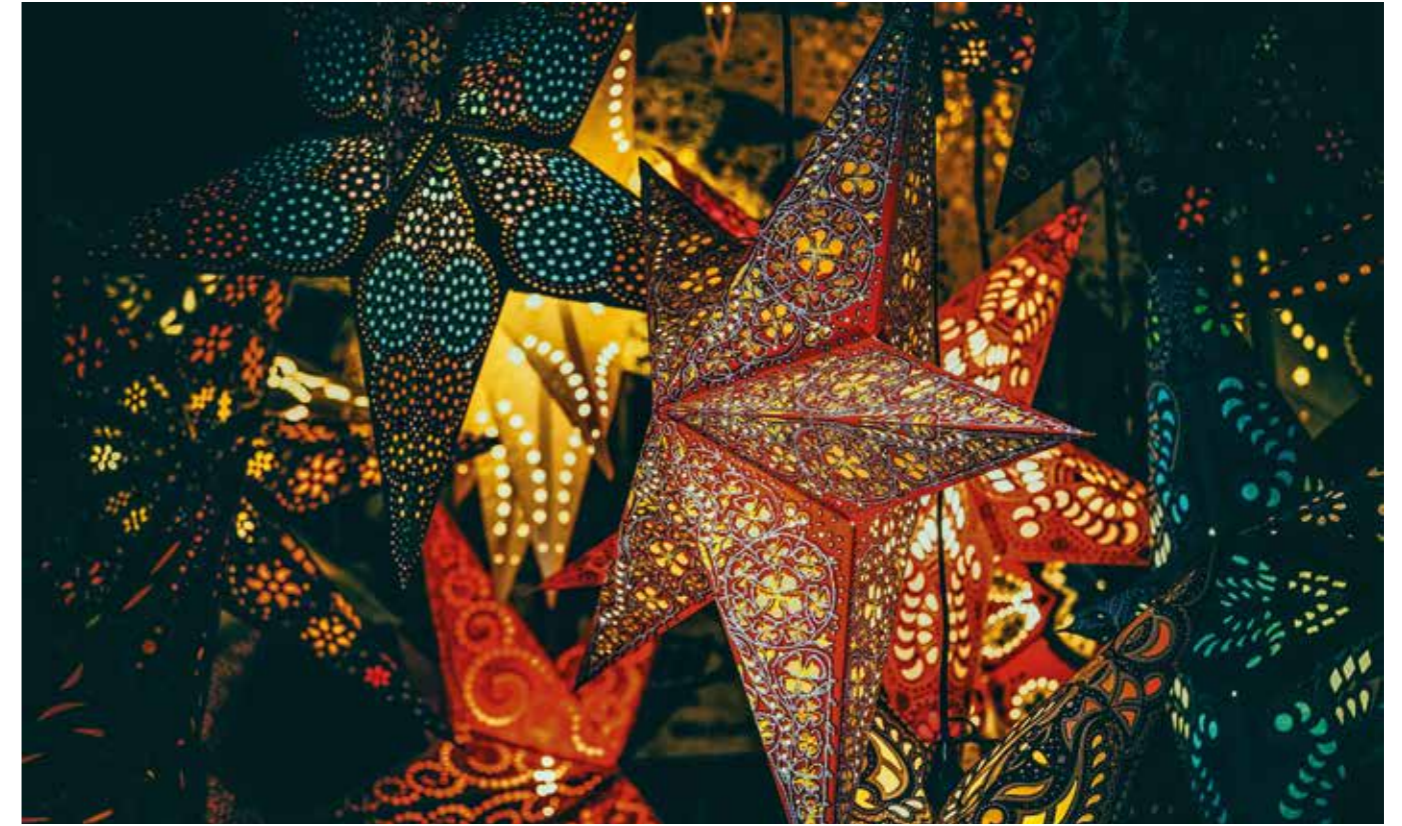
„Abschlussfest 19. November 2022“