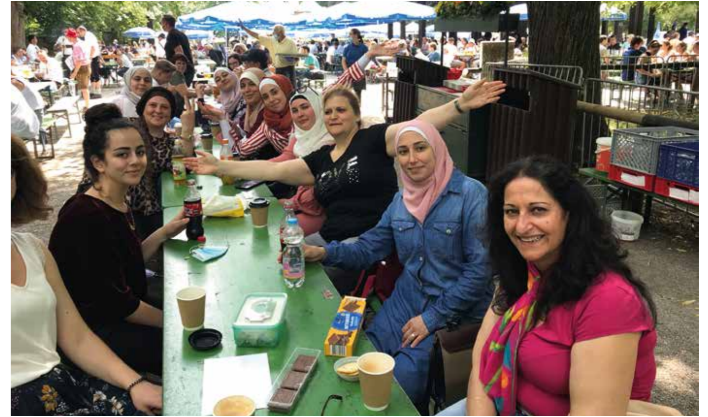
„Englischer Garten“ Bally Prell Exkursion