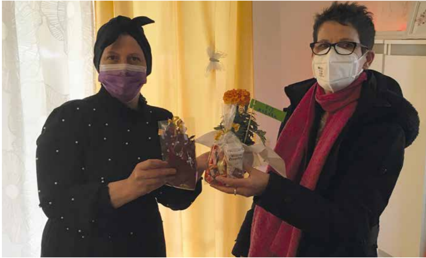
„30 Überraschungsbesuche an al-Fitr“