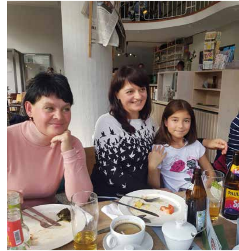
„Schöne Aussichten“ Bellevue di Monaco