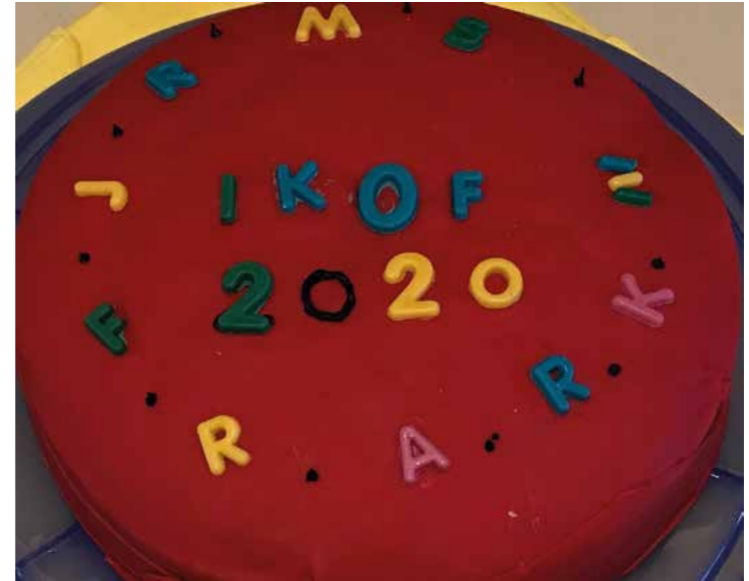
„ikoF feiert Geburtstag“ Erstes Projektjahr