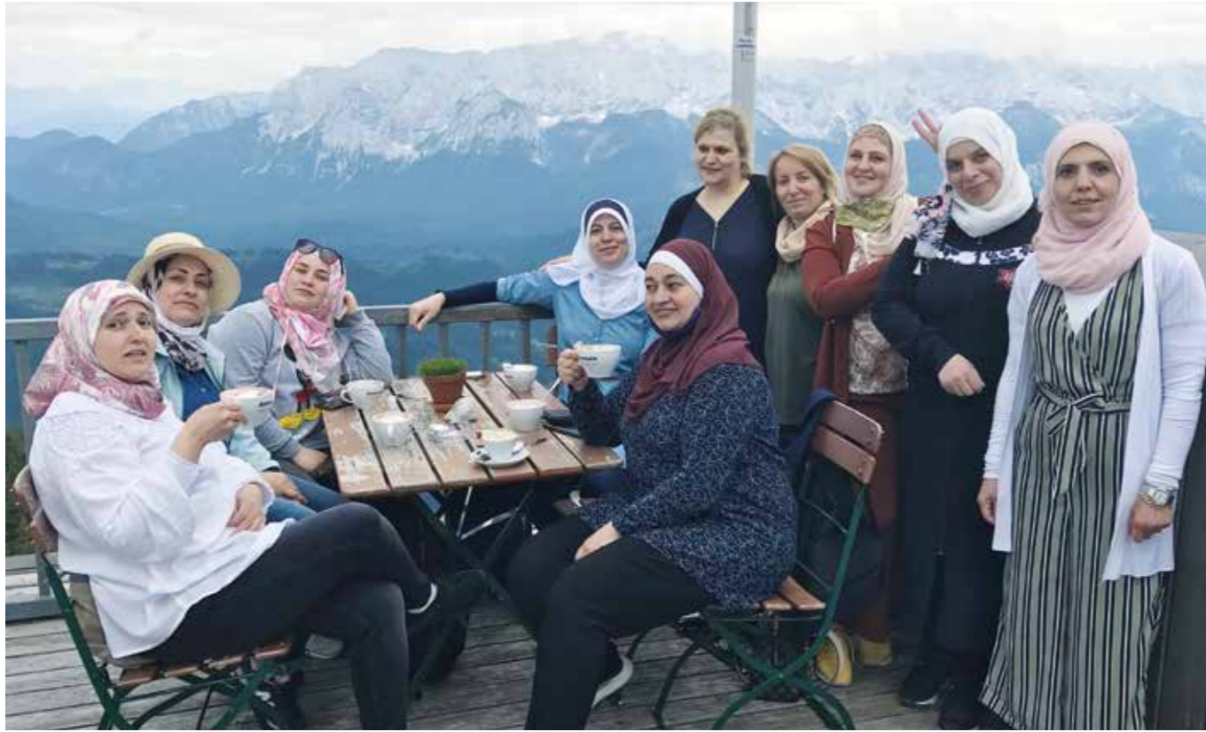
„Gipfeltreffen“ Erster Ausflug auf den Wank